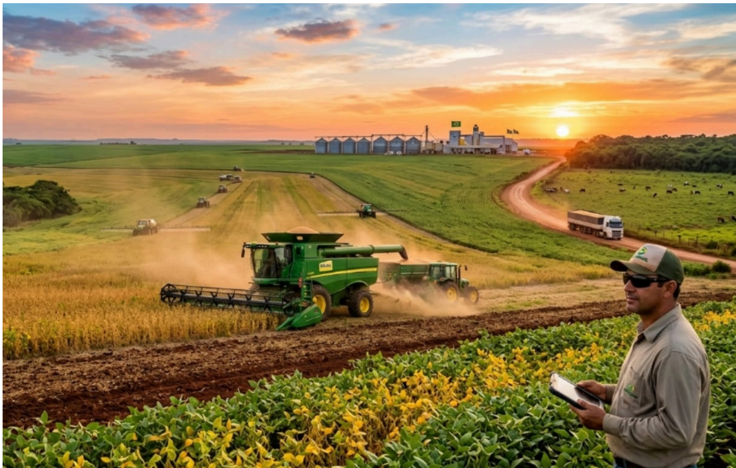
Imagem mostra colheitadeiras trabalhando em um campo agrícola num fim de tarde