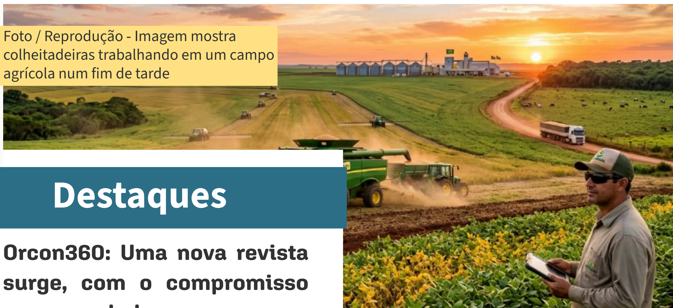
Foto / Reprodução - Imagem mostra colheitadeiras trabalhando em um campo agrícola num fim de tarde