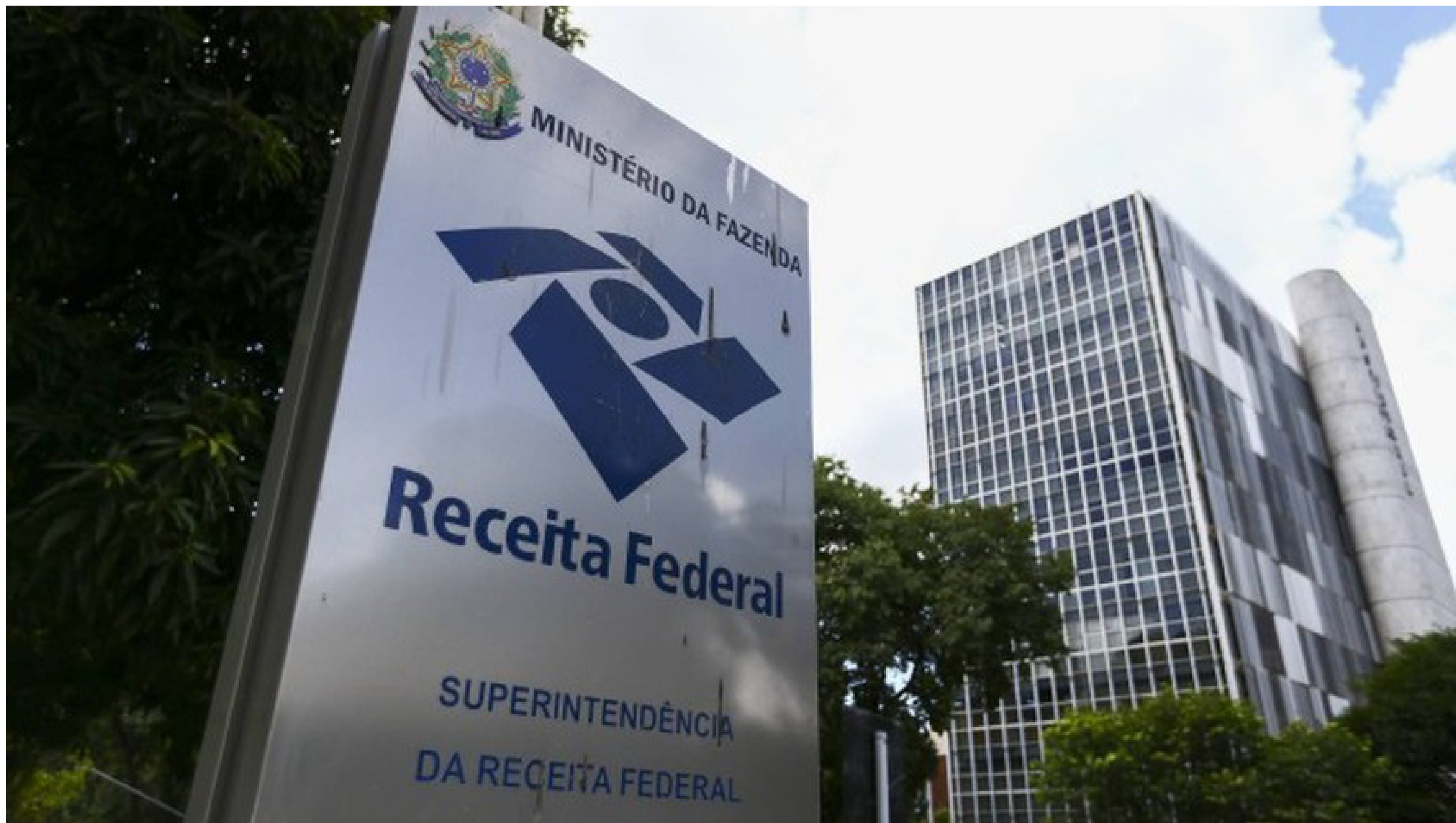
Imagem mostra fachada da Receita Federal

A partir do dia 31 de julho, a Receita Federal dará início à implementação do CNPJ Alfanumérico, um novo modelo de identificação para pessoas jurídicas no Brasil que passará a combinar letras e números. O anúncio oficial detalha o cronograma e o funcionamento da transição para o novo formato.