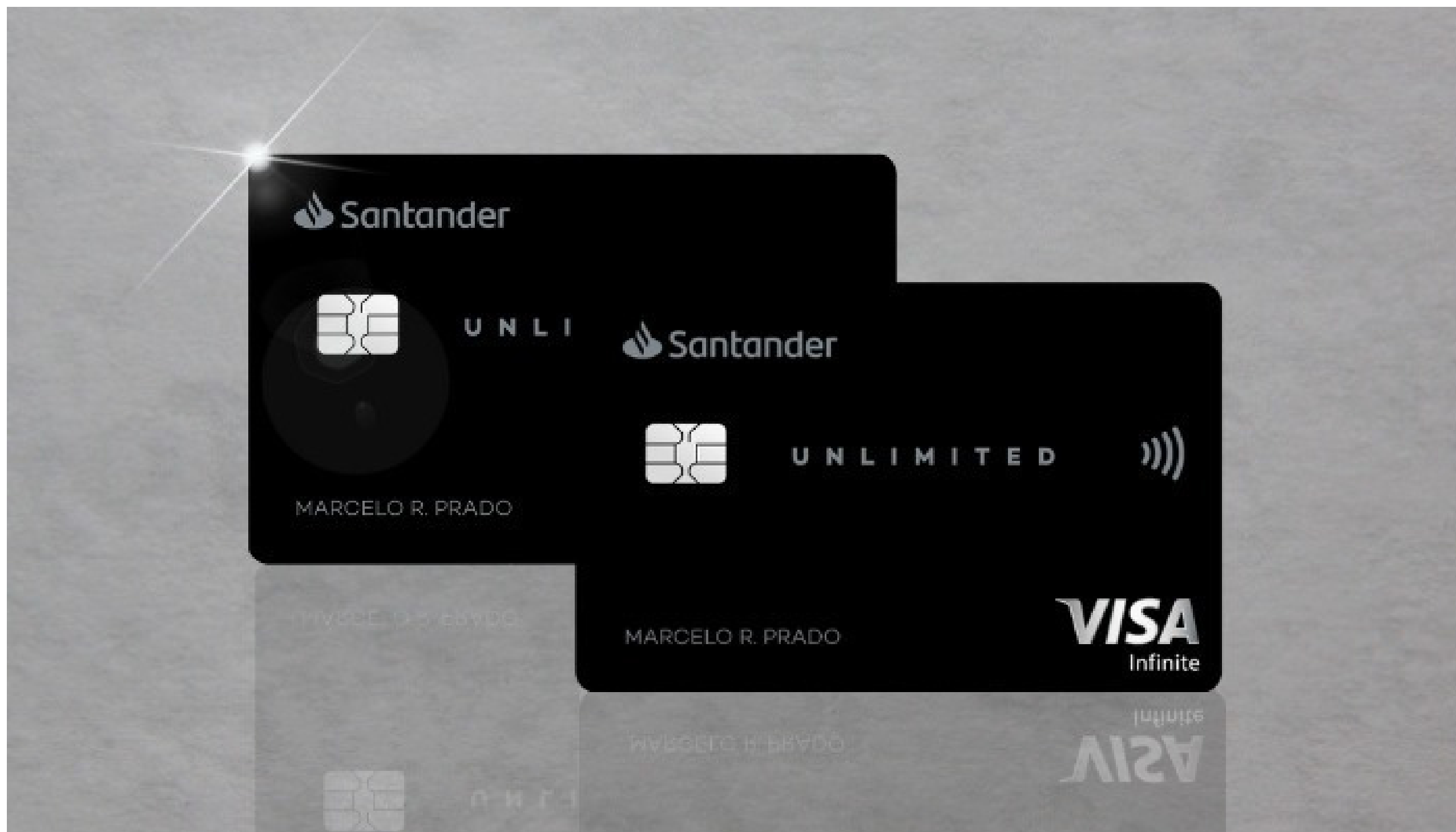
Imagem mostra representação de um cartão Black do Santander