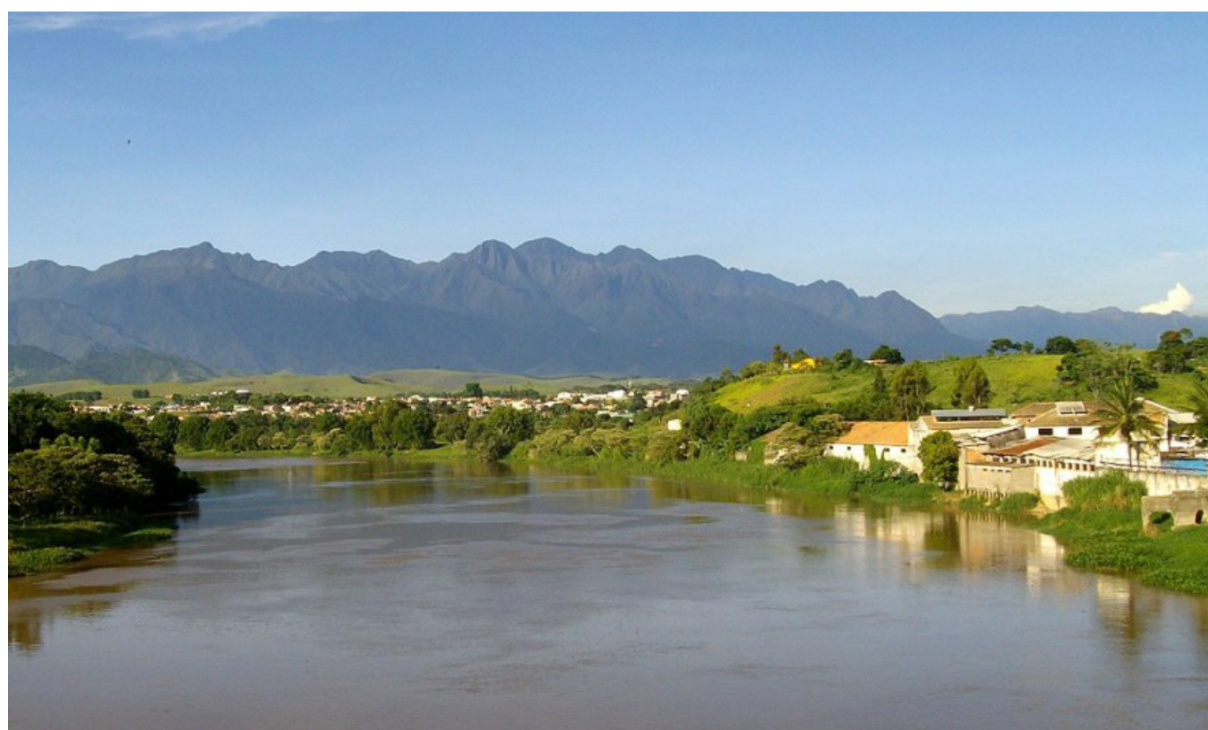
Bacia Hidrográfica do Paraíba do Sul