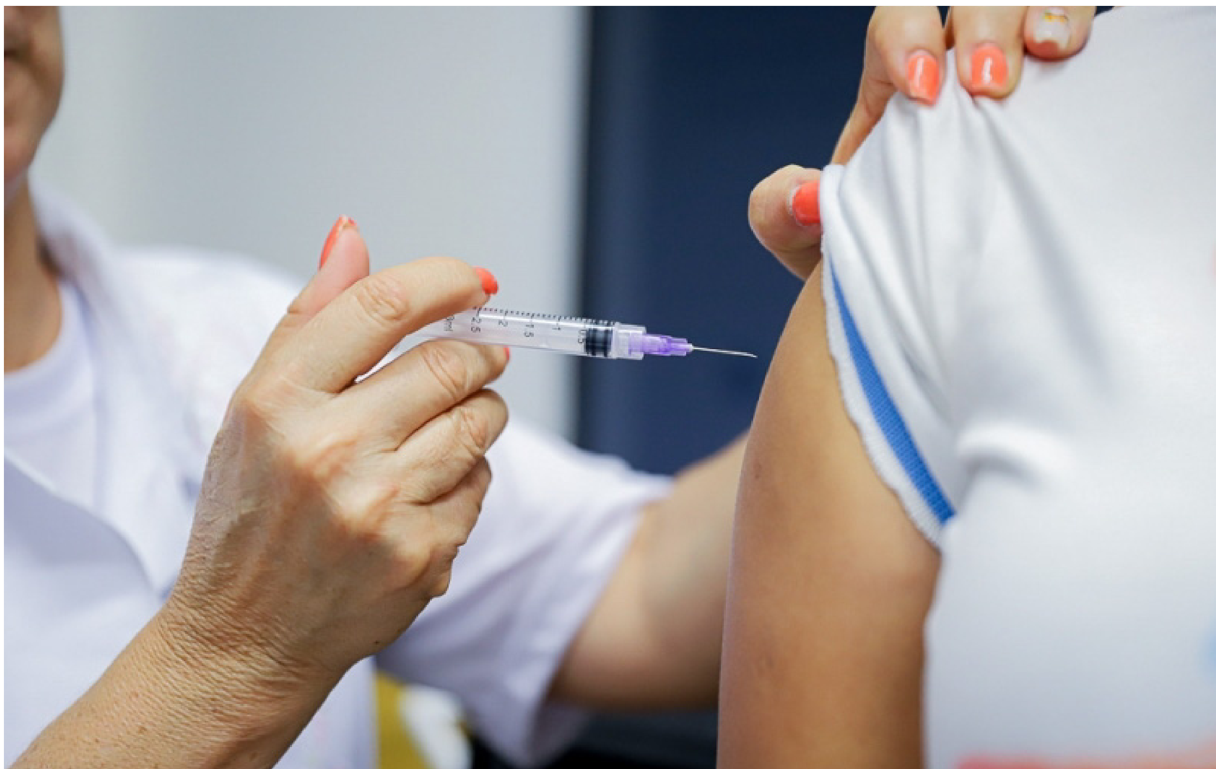
Imagem representa pessoa recebendo vacina contra o HPV

O Ministério da Saúde prorrogou o prazo da estratégia de resgate vacinal contra o papilomavírus humano, o HPV, para adolescentes e jovens na faixa etária de 15 a 19 anos. Com a nova determinação, esse público terá até o dia 31 de dezembro para procurar as unidades de saúde e garantir a imunização de forma gratuita pelo Sistema Único de Saúde, o SUS.