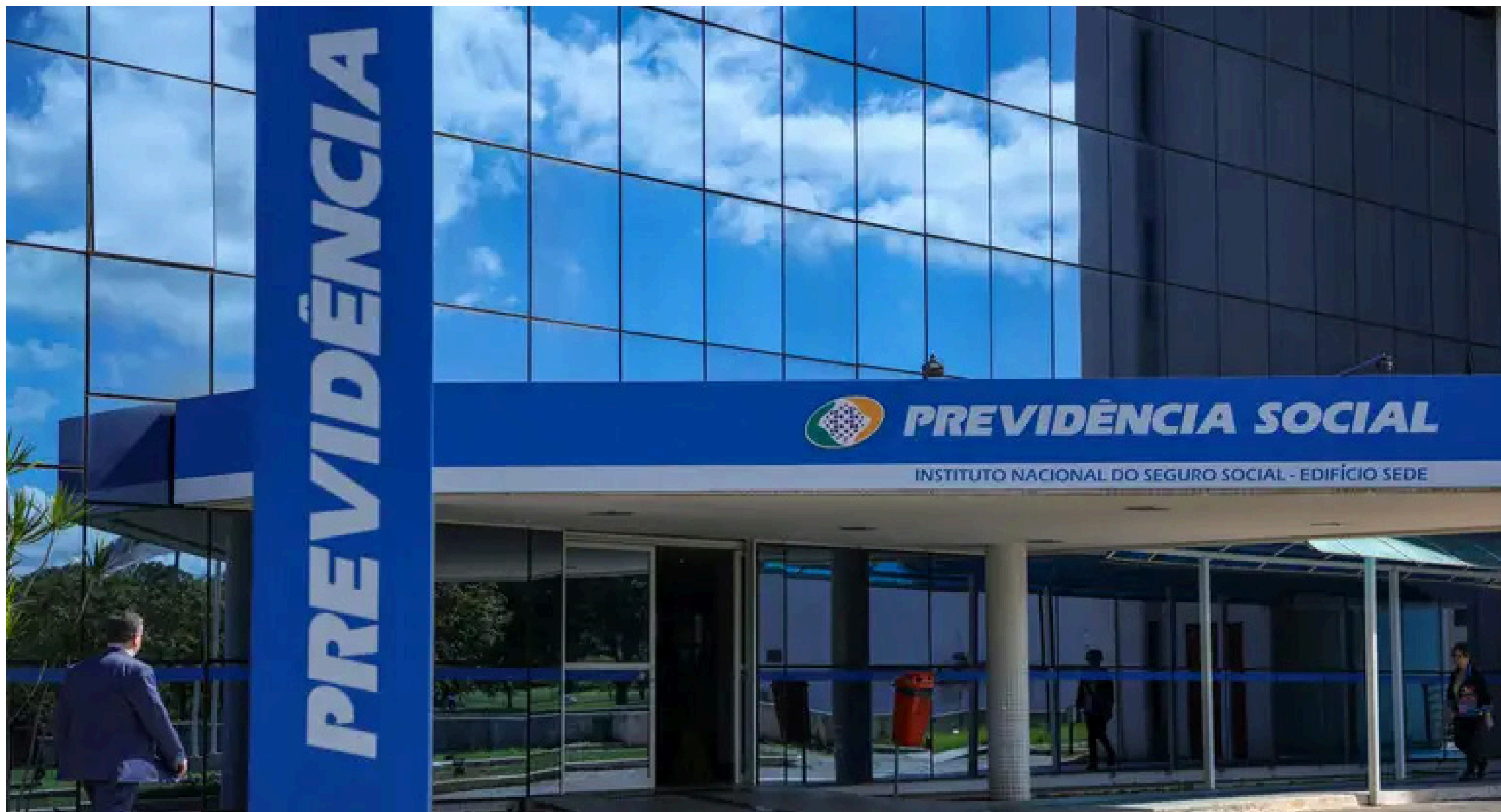
Imagem mostra fachada de uma agência do INSS